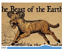
13: Besta da Terra