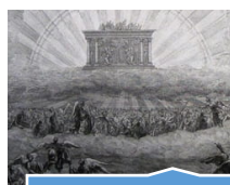
14: 144 mil selados