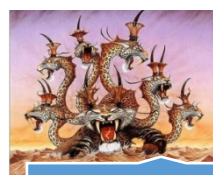
13: Besta do Mar